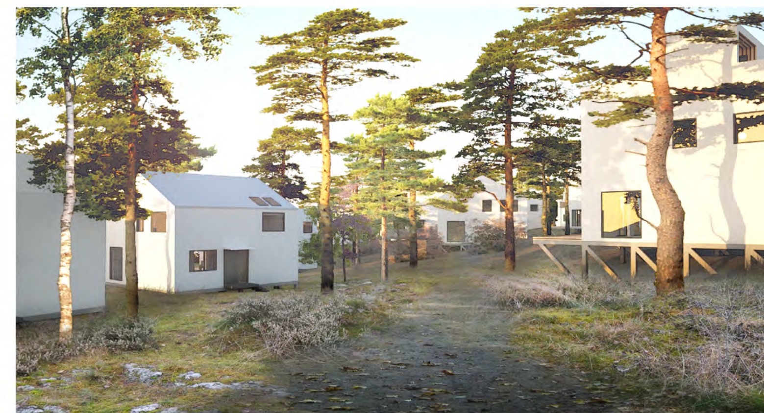
Kullen - exempel på villor bild Sandellsandberg arkitekter