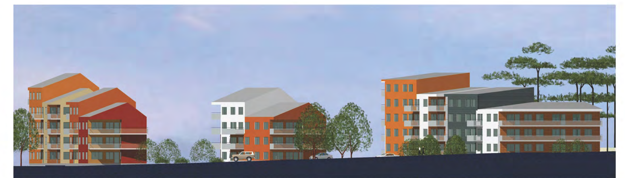
Roddaren - exempel på flerbostadshus bild AWL arkitekter