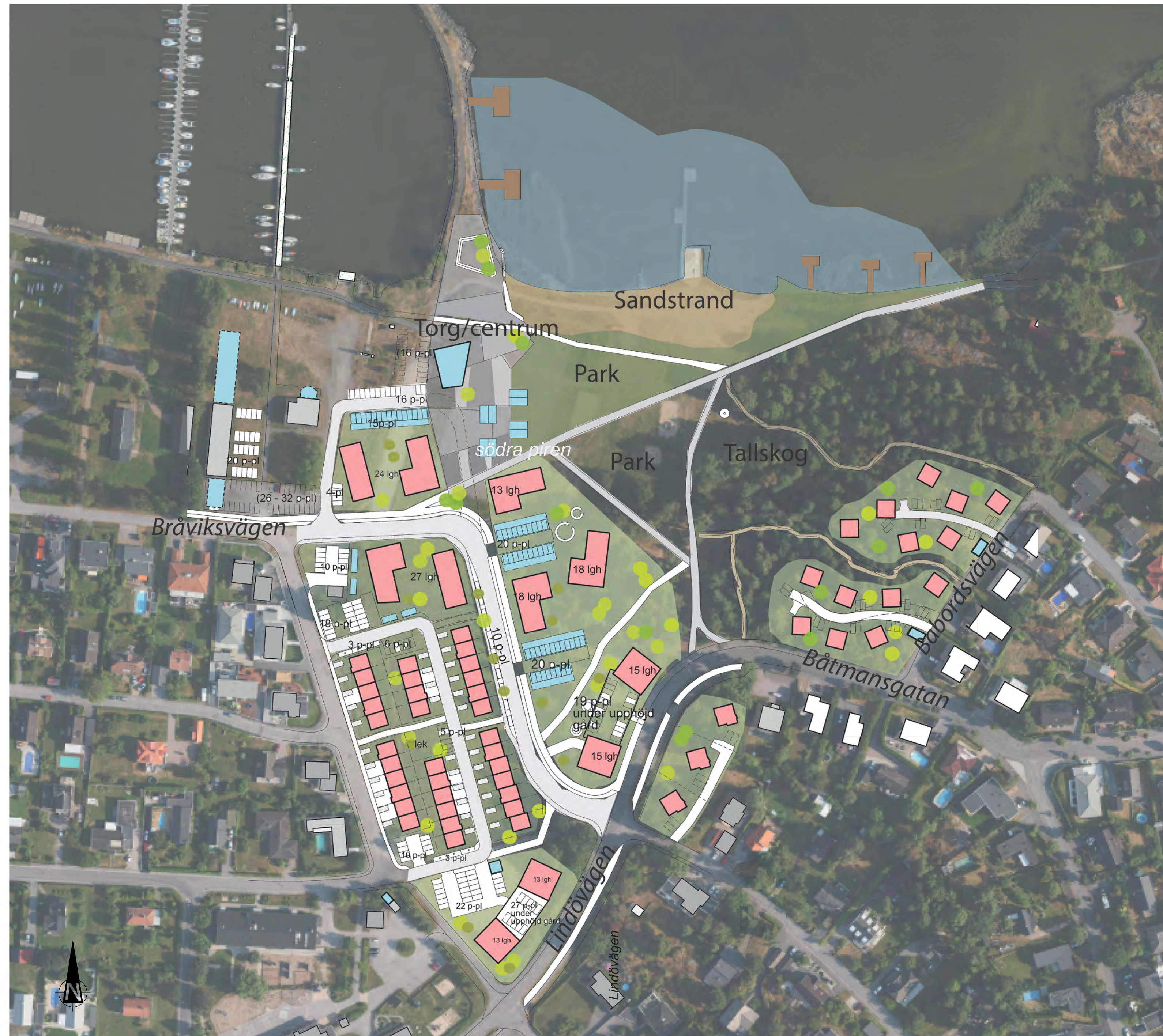
Situationsplan bild AWL arkitekter