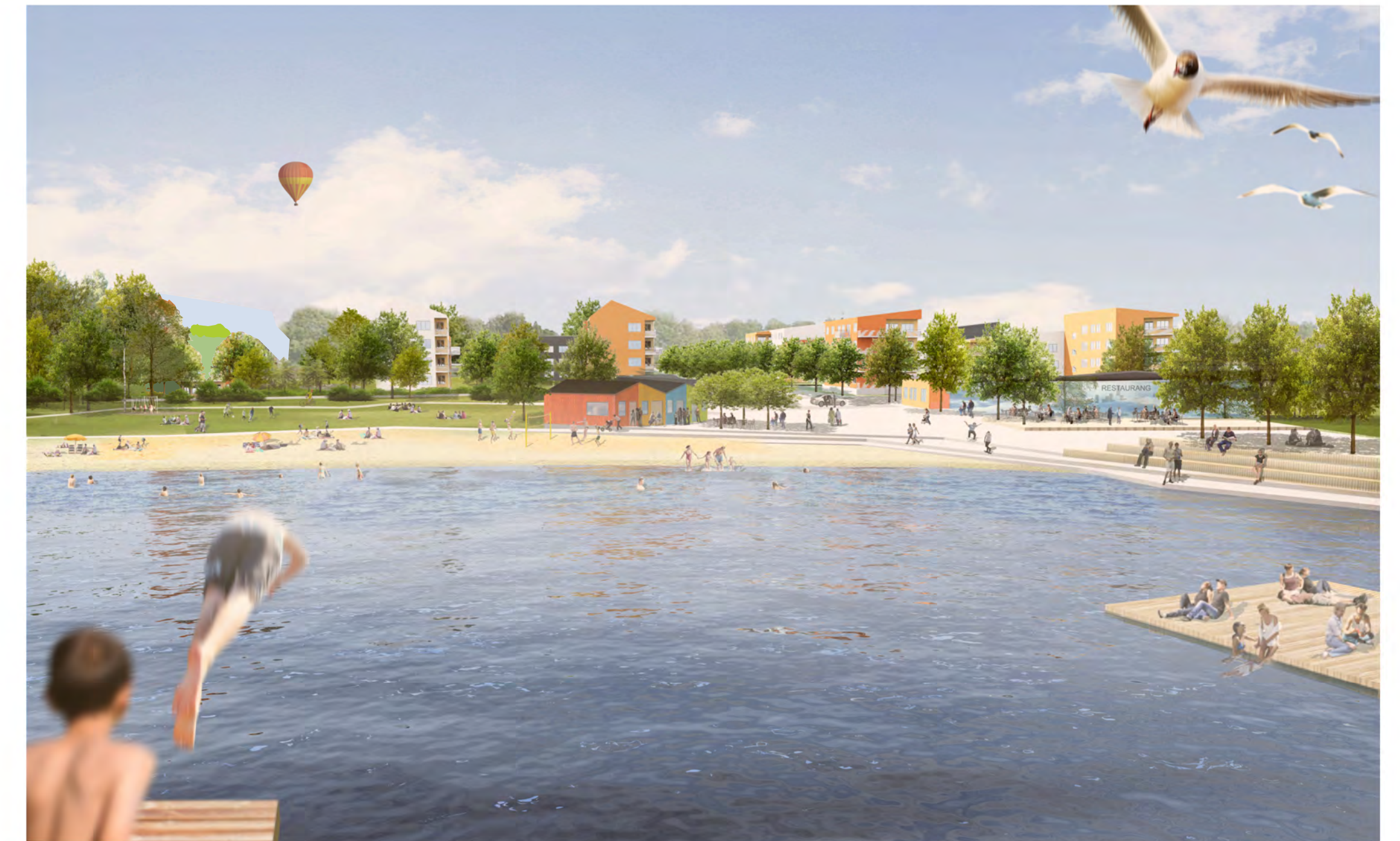
Vision badstranden och torget bild AWL arkitekter