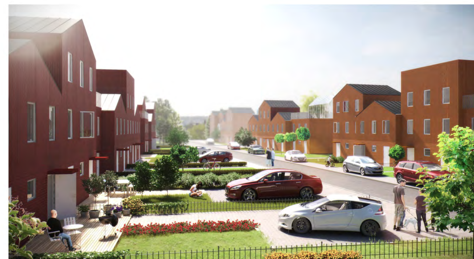
Roddaren - exempel på radhus bild Sandellsandberg arkitekter