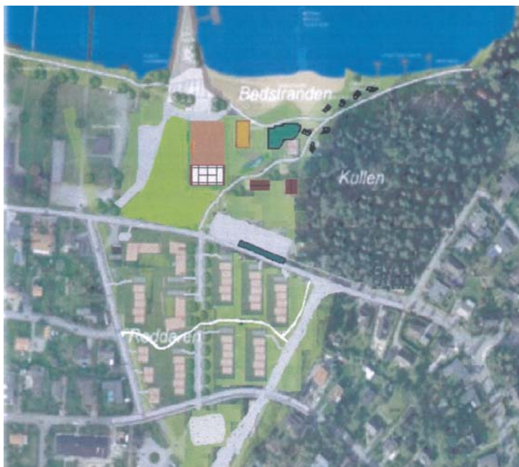
Skissen ovan visar Lindö villaägareförenings förslag för utveckling inom planområdet och har bifogat deras synpunkter.

Lindö villaägareförenings motiveringar till en begränsad höjd och utbredning av bebyggelsen är en bibehållen karaktär och olämpligheten att bygga i riskområden för översvämning.